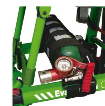
Uchwyt na butlę z tlenem 6250-140-000