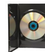
Film szkoleniowy 6253-001-167