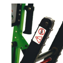
Pas Aggressive Stair TREAD 6253-070-000