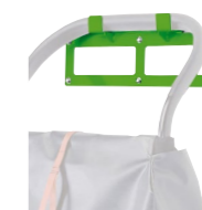
Uchwyt ścienny 6254-050-000